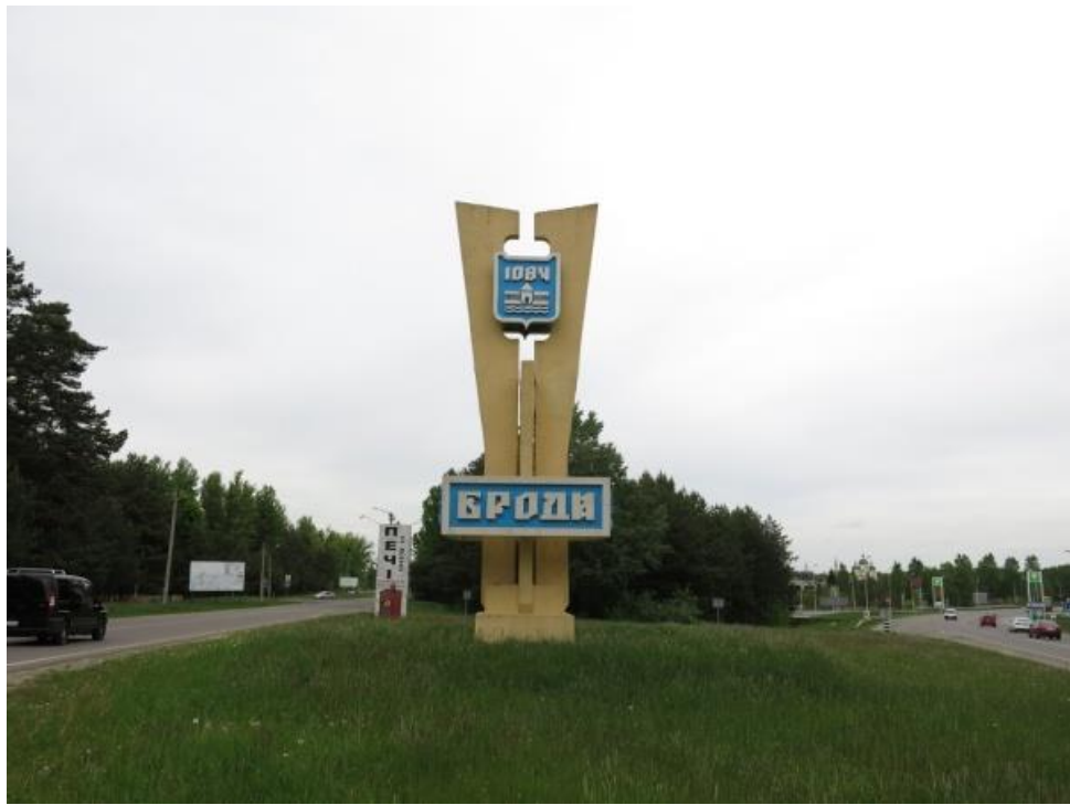
Nasza szkoła współpracuje ze szkołą w Brodach od 2003 roku.