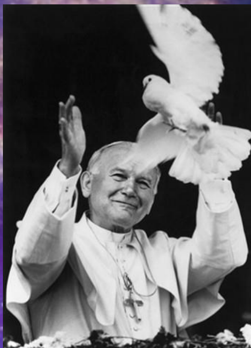
JAN PAWEŁ II PAPIEŻ