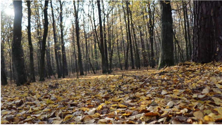
Natalia Fryc, kl. VIIB